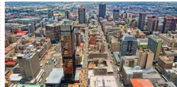
Görsel: Johannesburg / Güney Afrika Cumhuriyeti

Madencilik: Nüfusun dağılışını etkileyen faktörlerden bir diğeri sanayiyle birlikte önemi daha da artan madencilik faaliyetidir. Bir bölgede ekonomik değeri yüksek olan madenin yeterli miktarda bulunması, o madeni çıkarma ve işleme faaliyetlerine bağlı olarak nüfusun dağılışını etkiler. Güney Afrika Cumhuriyeti'nin Johannesburg şehri elmas ve altının yoğun olarak çıkarıldığı yerler olmasından dolayı sık nüfuslu alanlara örnek verilebilir.