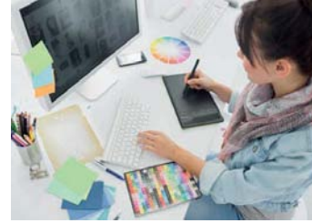
Dördüncül ekonomik faaliyetten reklam yayıncılığı

Dördüncül ekonomik faaliyetler , teknolojinin gelişmesine bağlı olarak günümüzde ortaya çıkan bilgi toplama, bilgiyi işleme, değiştirme ve yayma çalışmalarını kapsar. Reklam yayıncılığı, yazılım hizmetleri, ağ işletmeciliği ve grafik tasarım hizmetleri dördüncül ekonomik faaliyetlerden bazılarıdır. Coğrafi bilgi sistemlerinin ortaya çıkmasıyla bu faaliyetler daha fazla gelişmiştir.