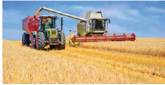
Birincil ekonomik faaliyetlerden tarım

Birincil ekonomik faaliyetler , temel maddelerin doğrudan veya dolaylı olarak doğal çevreden temin edilmesine dayanır. Avcılık, toplayıcılık, balıkçılık, ormancılık, madencilik, tarım ve hayvancılık bu tür faaliyetlere örnek verilebilir. Bu yolla elde edilen ürünler, doğrudan tüketilebileceği gibi sanayi faaliyetlerinde ham madde olarak da kullanılabilir. Ülkelerin gelişmişlik seviyelerinin artması ve teknolojik imkânlardan daha fazla yararlanılmasıyla bu faaliyette çalışanların oranı giderek azalmaktadır.