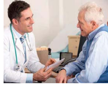
Üçüncül ekonomik faaliyetlerden sağlık hizmetleri

Üçüncül ekonomik faaliyetlerde doğrudan bir üretim görülmekle birlikte insanlara ve diğer ekonomik faaliyetlere ürün ve hizmet sağlanması esastır. Bu faaliyet türüne eğitim, sağlık, ulaşım, turizm, ticaret, bankacılık, pazarlama, güvenlik, sigortacılık, hukuk, belediye ve büro hizmetleri örnek verilebilir. Ülkelerin gelişmişlik seviyeleri arttıkça bu faaliyette çalışanların oranı da artmaktadır.