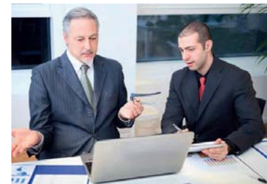
Beşincil ekonomik faaliyetlerden şirket yöneticiliği

Beşincil ekonomik faaliyetler , daha çok karar verme pozisyonunda olan kamu sektörü ile özel sektördeki üst düzey yöneticileri kapsar. Bu sektörlerde faaliyet gösterenlerin sayısı az olmasına rağmen dünya ekonomisine etkileri oldukça fazladır.