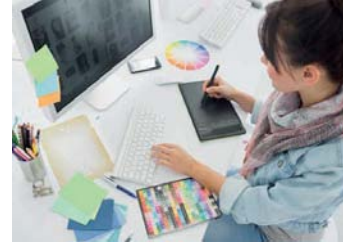
Dördüncül ekonomik faaliyetlerden reklam yayıncılığı

Dördüncül ekonomik faaliyetler , teknolojinin gelişmesine bağlı olarak günümüzde ortaya çıkan bilgi toplama, bilgiyi işleme, değiştirme ve yayma çalışmalarını kapsar. Reklam yayıncılığı, yazılım hizmetleri, ağ işletmeciliği ve grafik tasarım hizmetleri dördüncül ekonomik faaliyetlerden bazılarıdır. Coğrafi bilgi sistemlerinin ortaya çıkmasıyla bu faaliyetler daha fazla gelişmiştir.